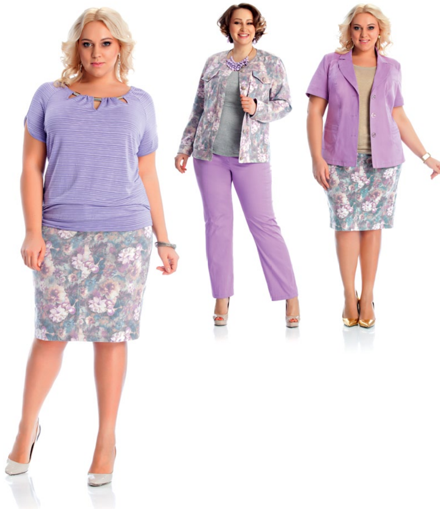
Жакет 894 Юбка 899 Топ 871