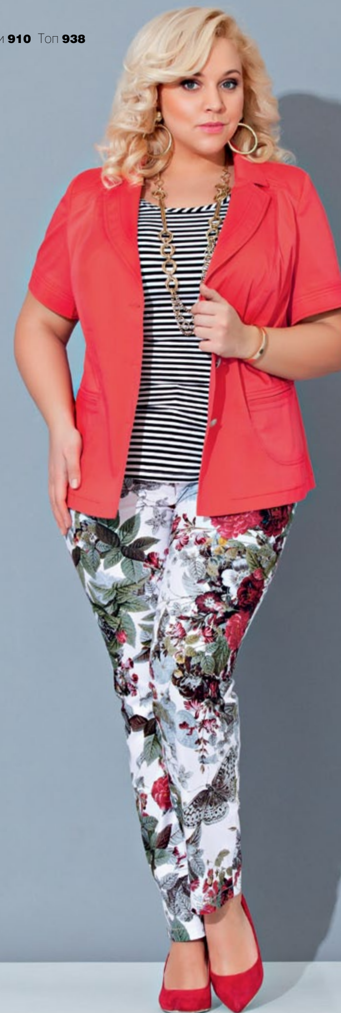
Жакет 894 Брюки 910 Топ 938