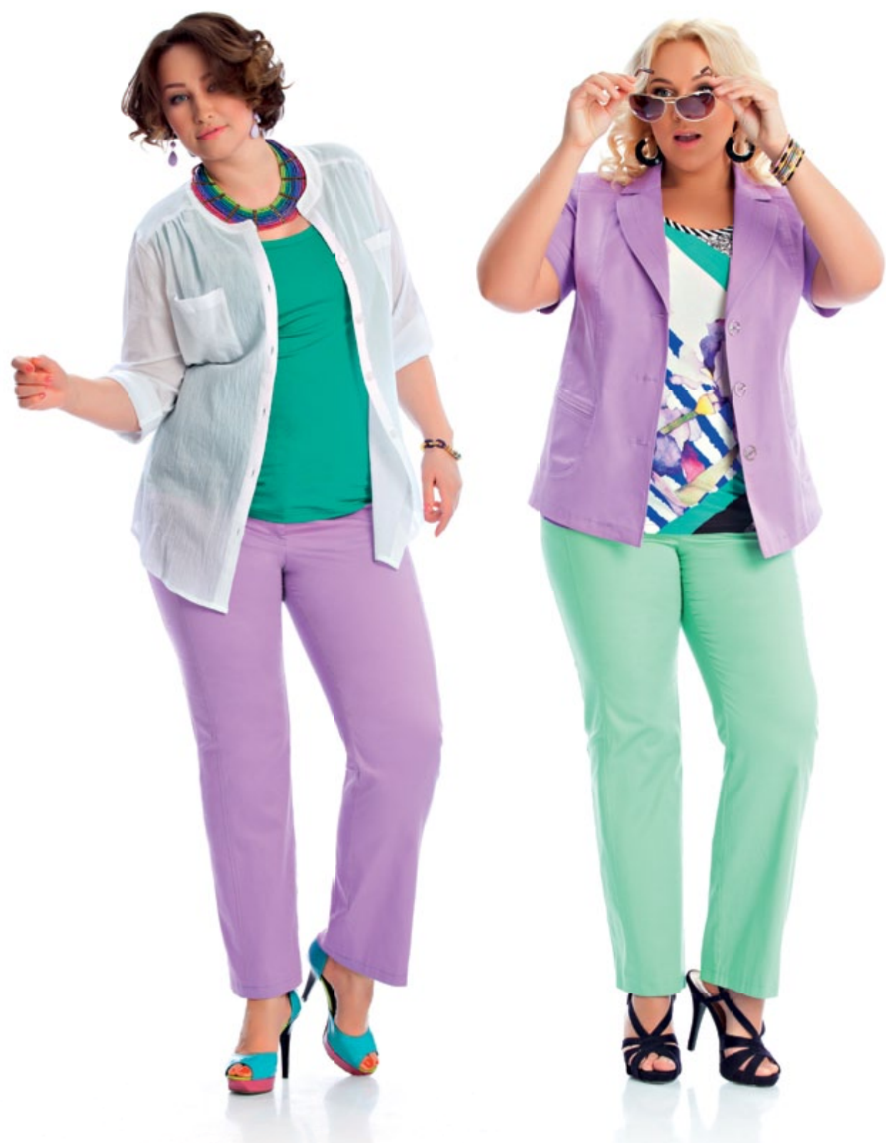
Блузка 907 Брюки 895 Топ 154

будто детской рукой разрезаны разные ткани и в виде аппликации соединены между собой. Еще один прием в создании модного принта