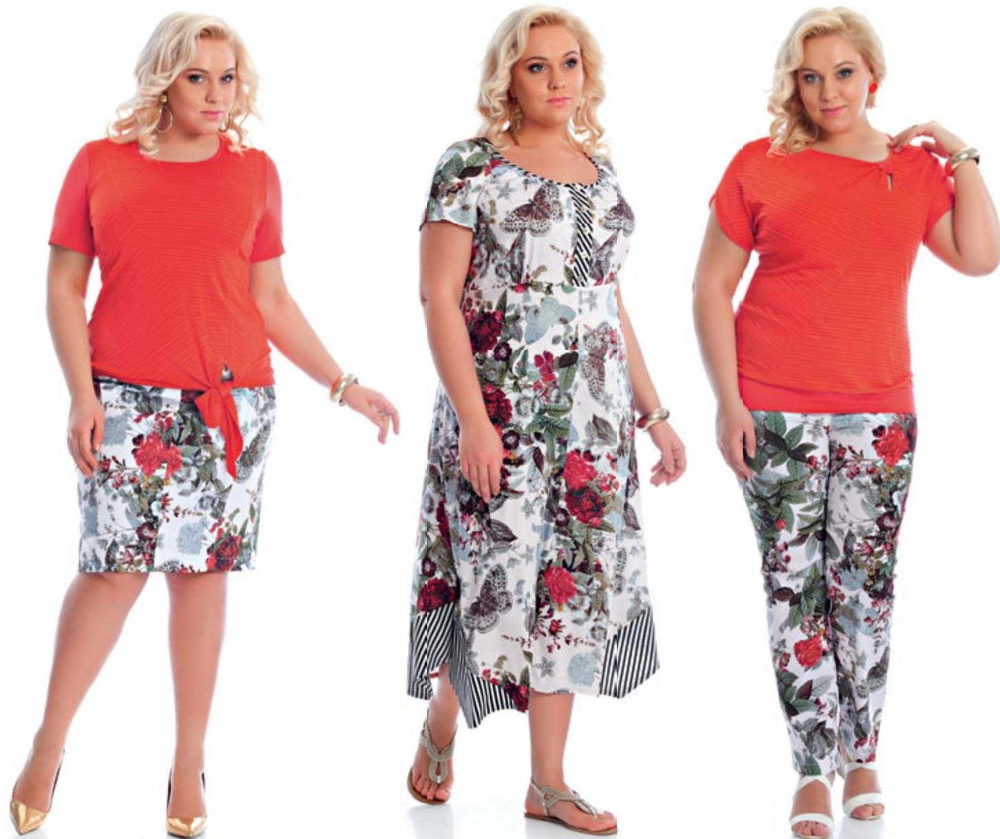
Блузка 948 Юбка 909

лету и солнцу... мы будто поместили на ткань ту картинку, в которой хотим оказаться наяву после холодной зимы. Только строгие формы, цветовые акценты и хладнокровное столкновение с жесткой графической полоской позволяют вместить это настроение во вполне городской комплект