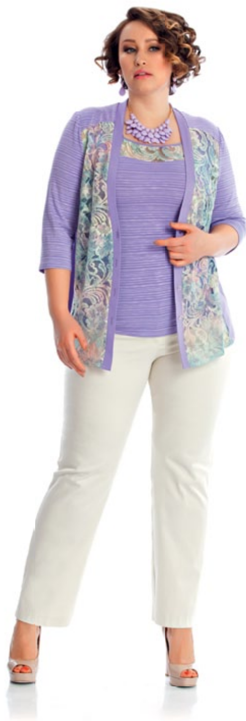
Комплект 924 Брюки 757

ИЗЫСКАННОЕ КРУЖЕВО для платьев, юбок и блузок как апофеоз женственности. При этом формы вполне демократичные, ведь вариативность в предназначении — ещё одна степень свободы