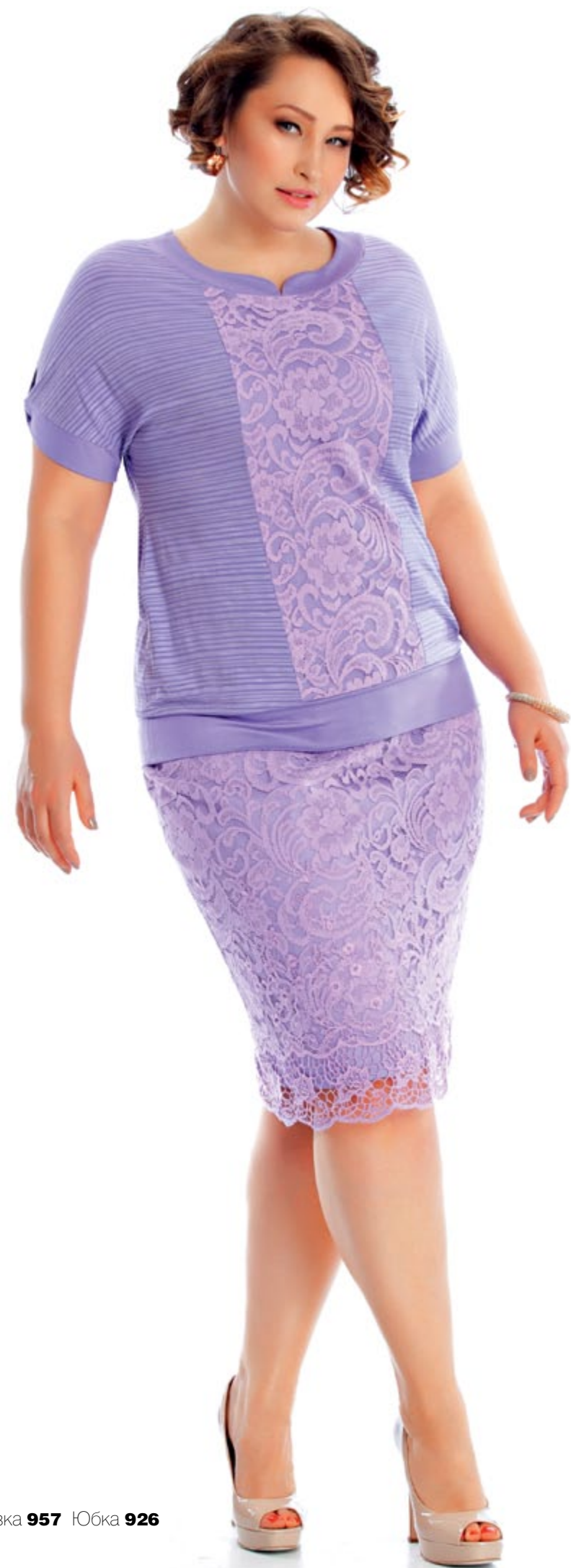
Блузка 957 Юбка 926

ИЗЫСКАННОЕ КРУЖЕВО для платьев, юбок и блузок как апофеоз женственности. При этом формы вполне демократичные, ведь вариативность в предназначении — ещё одна степень свободы