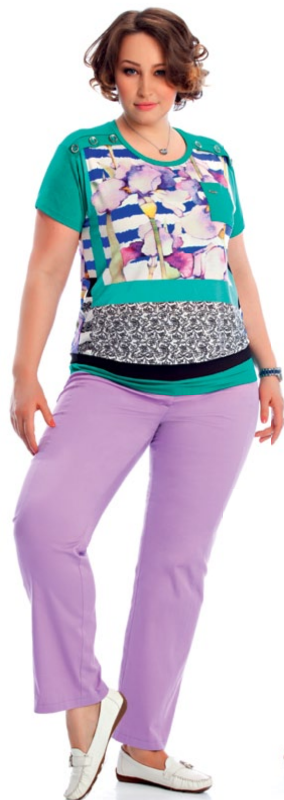
Блузка 942 Брюки 895