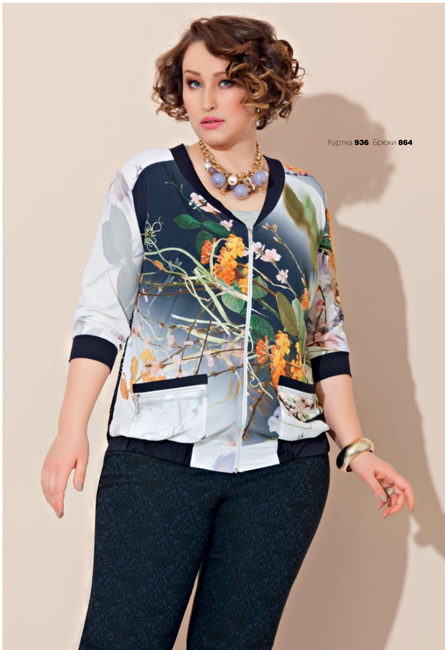
Куртка 936 Брюки 864