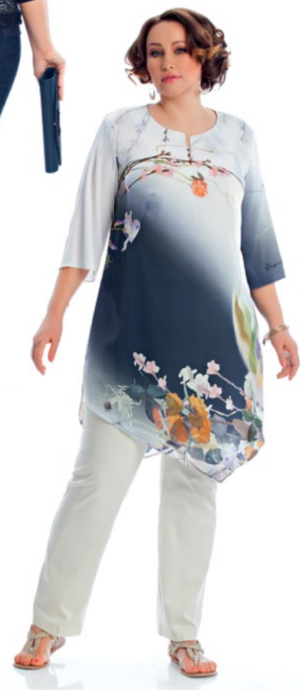
Блузка 934 Брюки 895