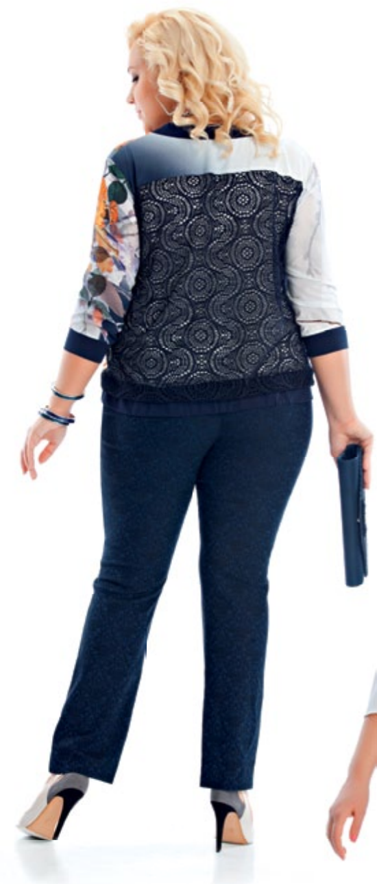
Туника 933 Брюки 757