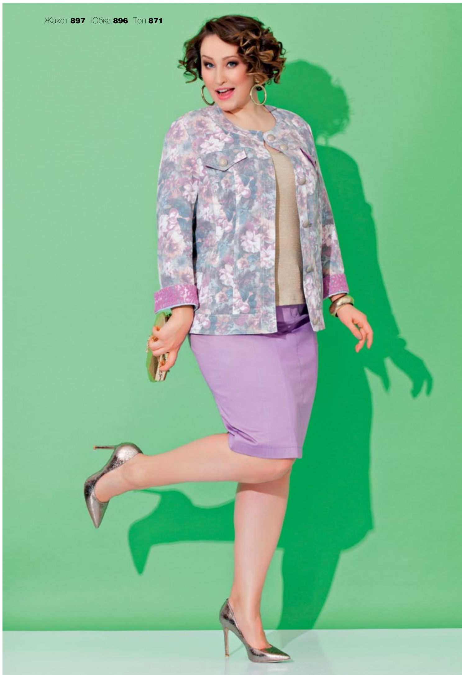
Жакет 897 Юбка 896 Топ 871