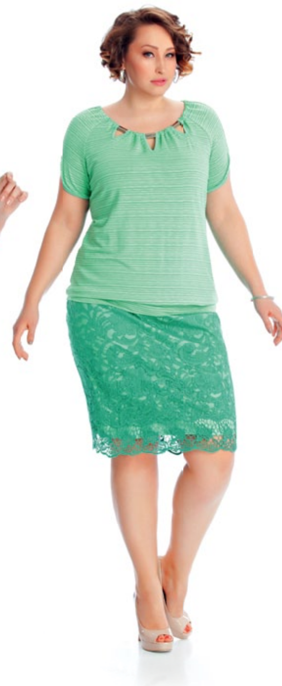
Блузка 960 Юбка 926